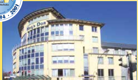
Restaurant & Café FRIESENSTUBE im Haus Hog'n Dor Neumünster