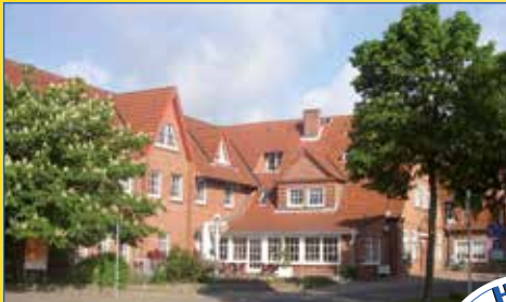
Haus Hog'n Dor Westerrönfeld