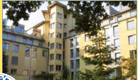
Haus Hog'n Dor Neumünster