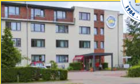
Haus Hog'n Dor Norderstedt